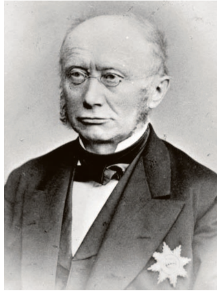
Klares Profil: Ludwig Windthorst (Foto aus dem Jahr 1890).

Die beiden kontrastierten schon rein äußerlich. Windthorst war ein kleiner Mann, der im Reichstag vom Platz des Abgeordneten aus redete, um nicht hinter dem Rednerpult zu verschwinden. Seine auffällige Physiognomie, über die er selbst gern spottete, machte ihn zu einer oft karikierten Figur im Feuilleton und begründete paradoxerweise seine Popularität. Die „kleine Exzellenz“ aus dem rückständigen Emsland neben dem weltgewandten Staatsmann Bismarck in der Uniform des Kürassiers – das war ein mediales Leitmotiv im neuen Deutschen Reich. Im Alter war er nahezu blind und auf Vorleser und Schreiber angewiesen, reiste und redete trotzdem unermüdet, um die „katholischen Bataillone“ zusammenzuhalten, und hat im Reichstag, wenn richtig gezählt worden ist, insgesamt 2209-mal geredet.